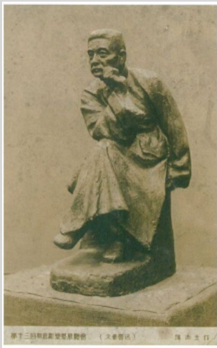
〈文豪魯迅〉1939 依魯迅塑像