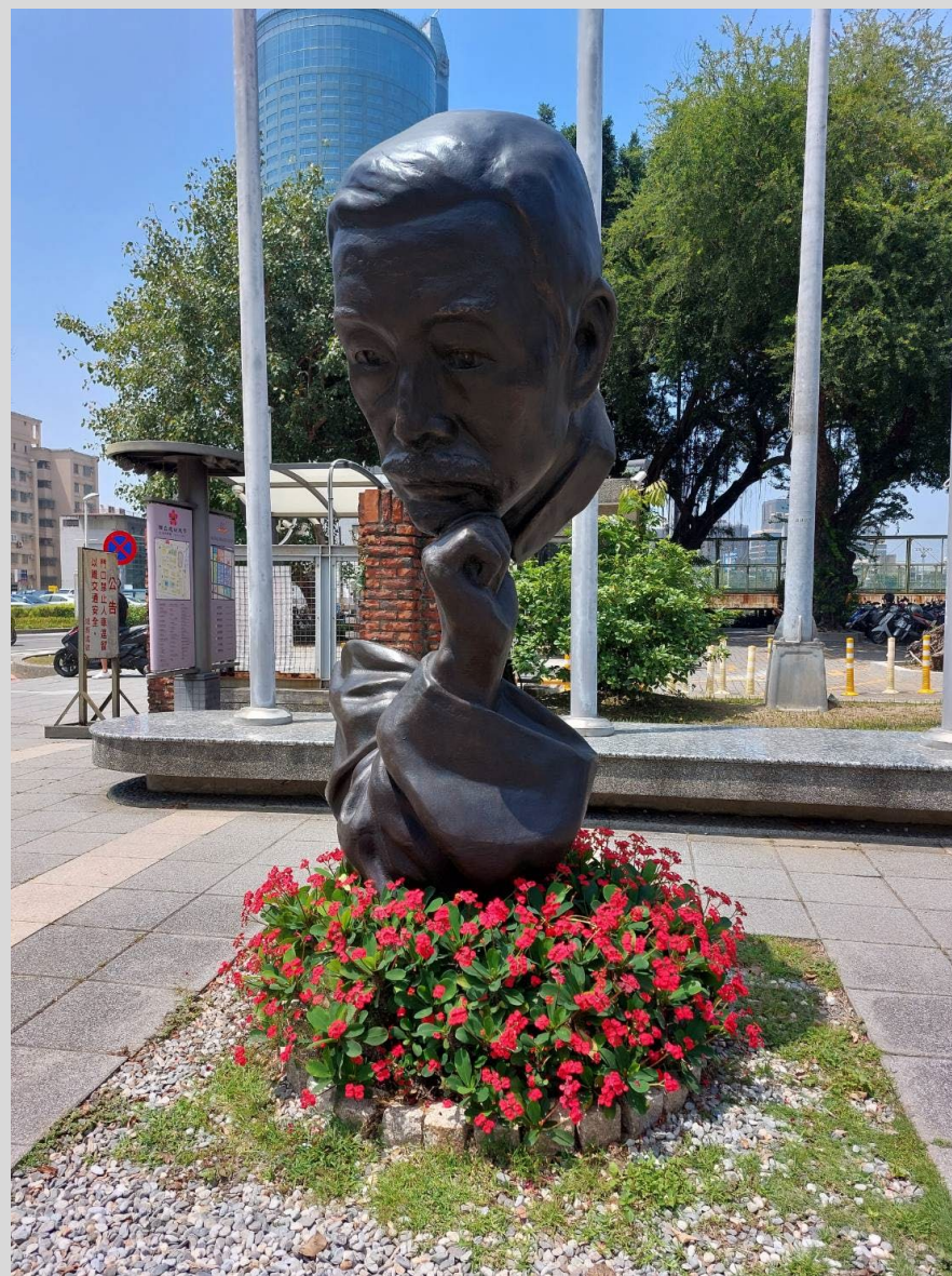
〈詩人局部〉2009 依陳重光塑像